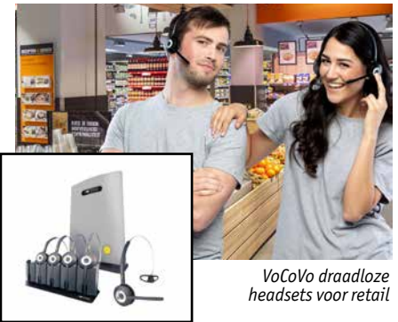
VoCoVo draadloze headsets voor retail

De Smart-Box herkent product verwijderingen van de IMCo Hook en Push en identificeert product verwijderingen door middel van patroonherkenning. Bij het verwijderen van een product activeert dit een akoestisch alarm. De Smart-Box werkt ook als een besturingseenheid om artikelen die niet op voorraad zijn te bewaken met een gateway naar de Cloud.